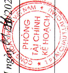
Biểu 1. Phân công việc đã thực hiện:

(Kèm theo Báo cáo số 765/BCTD-TCKH ngày 12/7/2022 của Phòng Tài chính – Kế hoạch thành phố Lai Châu)