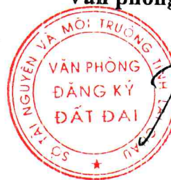
Đào Chế An